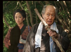
茂兵衛(泉谷しげる)